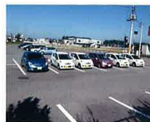
訪問車も毎日頑張っています