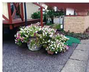
ご利用者様と散歩中撮った写真です