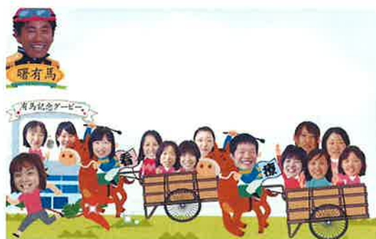
曙のスタッフです

私達の職場は女性が多く子育てをしながら仕事をしているスタッフもおり、お互いに助け合いながら日々の訪問を行っています。経験豊富なスタッフが多く、女性ならではのキメ細かいサービスと明るく元気な笑顔を提供しているステーションです。気楽に何でもご相談下さい。お待ちしております。