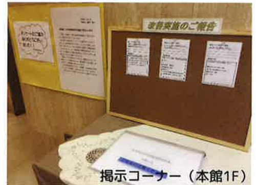
掲示コーナー（本館1F）

調査結果報告書は本館1F、 糖尿病センター1F、健診センター7F に掲示しております！